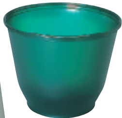
容器2個(緑)セット ¥22,800 (希望小売価格)

信じられないでしょうが、 生ゴミを乾燥させるのに熱は必要ないのです。 干し柿は寒い冬、軒下につるして北風にさらして作ります。 この先人の知恵に最新の技術を生かして出来たのが 「エアドライ」なのです。